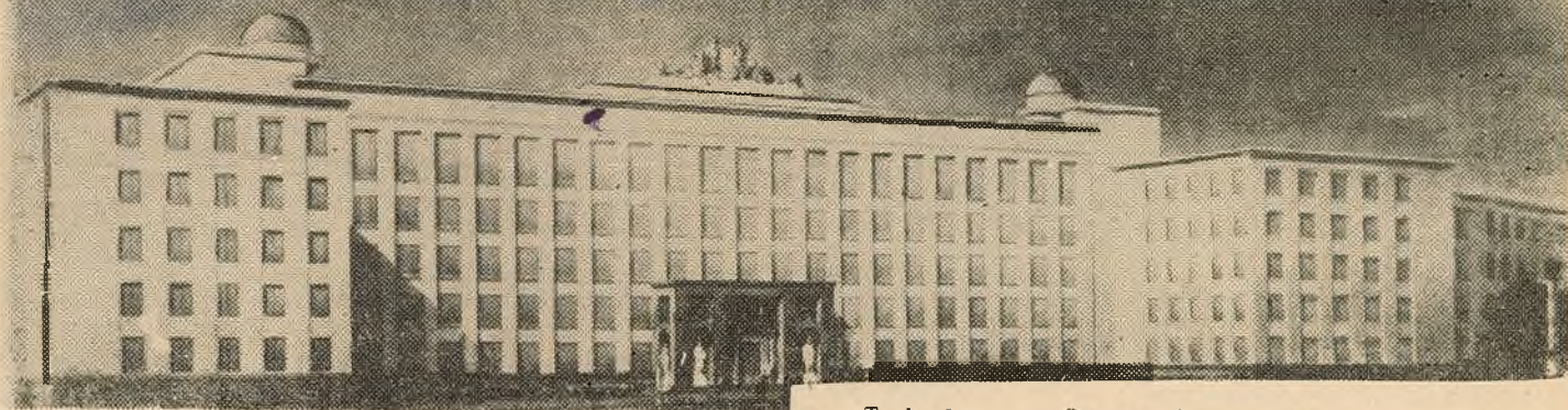
Такім будзе галоўны вучэбны корпус