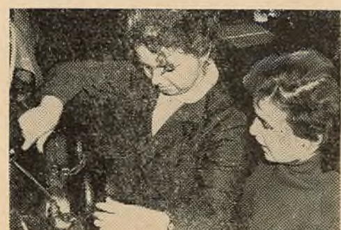
НА ЗДЫМКУ: студэнткі біяфака на лабараторных занятках.

Будучыя біялагі авалодваюць Гэтая спецыялізацыя студэнтаў ажыццяўляецца кафедрамі дарвінізму і генетыкі, фізіялогіі раслін, глебазнаўства, заалогіі хрыбетных жывёл, фізіялогіі чалавека і жывёл, на якіх працуюць такія вядомыя вучоныя, як прафесары Турбіні, Сяржаннін, Юньёў і іншыя.